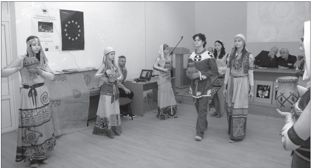
Показ колекції одягу

Після завершення виступу керівника Інституту відбувся показ колекції одягу «Далеке та близьке Трипілля»,