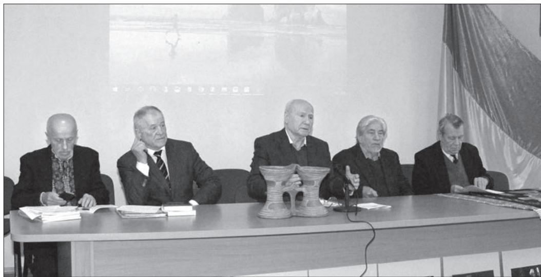
Виступає Василь Чернець

та відтворення ідентичності української нації в Україні та за кордоном» (керівник прикладної НДР (2023–2024) – О. О. Газізова); 5. «Українознавство у впровадженні національно-патріотичного виховання в освітній та гуманітарний простір України в умовах війни» (керівник прикладної НДР (2023–2024) – О. В. Шакурова); 6. «Особливості сучасної державної мовної політики в східних і деокупованих регіонах України» (керівник прикладної НДР (2023–2024) – Ю. О. Лебедева).